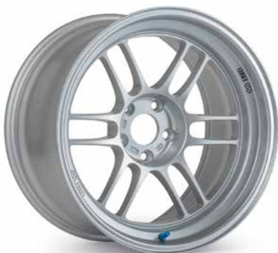
F1 Silver (SP)

Enkei a développé un nouveau procédé de fabrication pour produire la prochaine génération de jantes en aluminium. La "Most Advanced Technology" (MAT), qui signifie "la technologie la plus avancée", combine la technologie de roue moulée d'une seule pièce avec une technique de "repoussage" de la jante. L'utilisation de cette nouvelle technologie de moulage et de formage de la jante est essentielle pour améliorer radicalement les propriétés matérielles et la résistance des roues. En outre, la technologie de laminage de la jante d'Enkei façonne la jante pour améliorer l'allongement du matériau sans sacrifier la dureté de la roue.