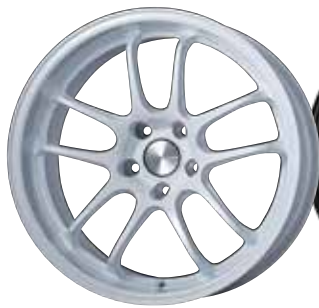
Pearl White (WP)