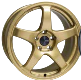
Gold (Special Order)