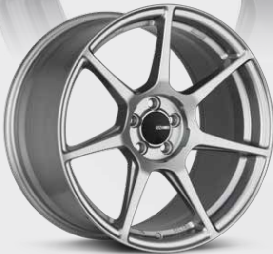
Storm Gray (GR)

Simplifier et apporter de la légèreté – c'est l'approche adoptée par Enkei avec la roue TFR de la série de personnalisation. Sept rayons aux contours parfaits partent d'un centre aux découpes soigneusement placées pour réduire le poids autant que possible. Avec la TFR, vous pouvez faire de l'autocross la fin de semaine et vous rendre au travail la semaine. Elle est vraiment polyvalente. La TFR est offerte en modèles de 17, 18 et 19 po avec des finis cuivre, gris tempête et bronze industriel. Le look se complète avec le chapeau de roue central plat caractéristique d'Enkei.