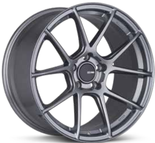
Storm Gray (GR)