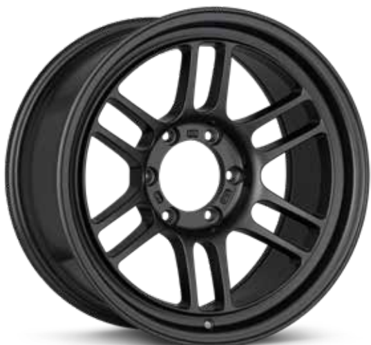
Matte Dark Gunmetal (GM)