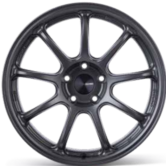
Matte Gunmetal / front angle (GM)