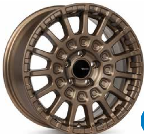
Matte Bronze (ZP)

Voici la série de performance d'Enkei. La série de performance d'Enkei représente l'ultime combinaison de style, de performance et de valeur dans le secteur des roues du marché secondaire. L'ingénierie experte et la fabrication de classe mondiale d'Enkei nous permettent d'offrir des roues de haute qualité dans une grande gamme d'applications de véhicules, sans pour autant vide son compte bancaire.