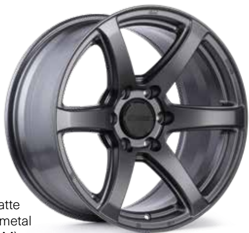
Matte Gunmetal (GM)

Voici la série pour camions d'Enkei. Bien qu'Enkei soit surtout reconnu pour ses roues de voiture haute performance, il est fier de proposer une gamme de roues conçues pour les camions et les VUS. Enkei a mis en œuvre ses capacités d'ingénierie inégalées pour concevoir plusieurs modèles qui répondront aux exigences élevées que les conducteurs de camions et de VUS imposent à leurs roues. En utilisant les installations de fabrication de classe mondiale d'Enkei et en mettant l'accent sur la fonction plutôt que sur l'apparence, la série pour camions d'Enkei offre un excellent moyen pour les propriétaires de camions et de VUS d'ajouter un peu de style à leur véhicule, tout en conservant la résistance et la robustesse nécessaires aux roues de leurs véhicules.