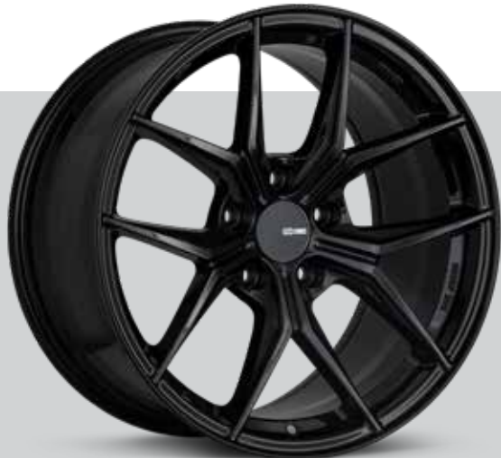
Gloss Black (BK)

Cap# A476-CAPBK, Cap# for 5x120 BMW size, Cap# A476-CAPBK BMW