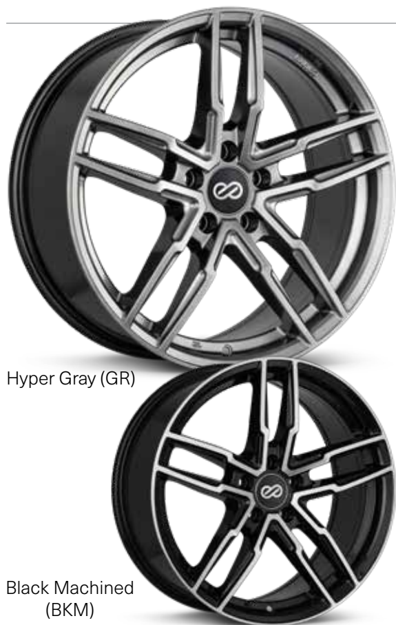
Hyper Gray (GR)