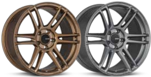
Matte Bronze (ZP) Titanium Gray (GR)