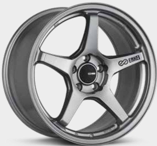
Storm Gray (GR)