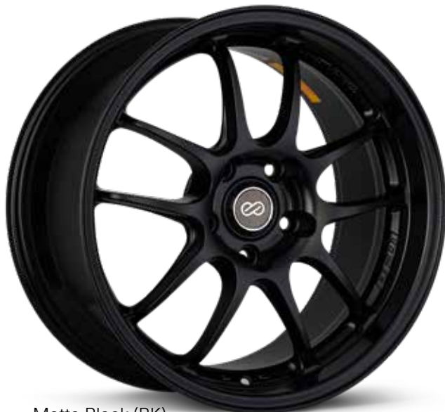
Matte Black (BK)