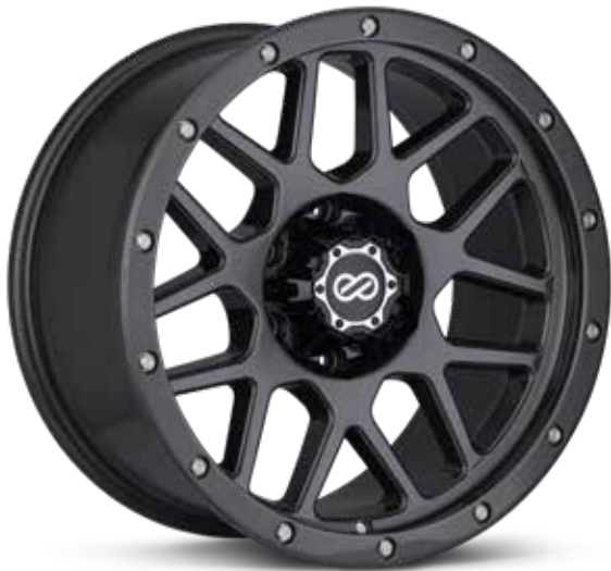
Gloss Gunmetal (GM)