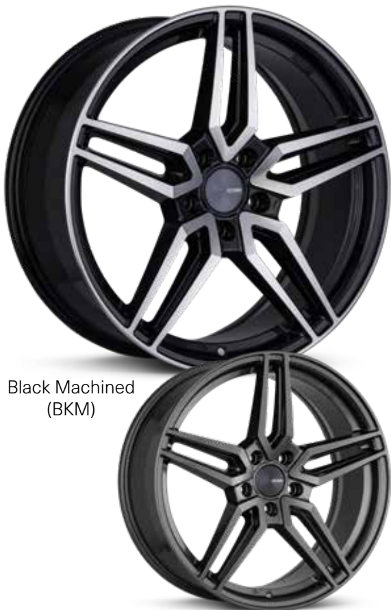
Black Machined (BKM)