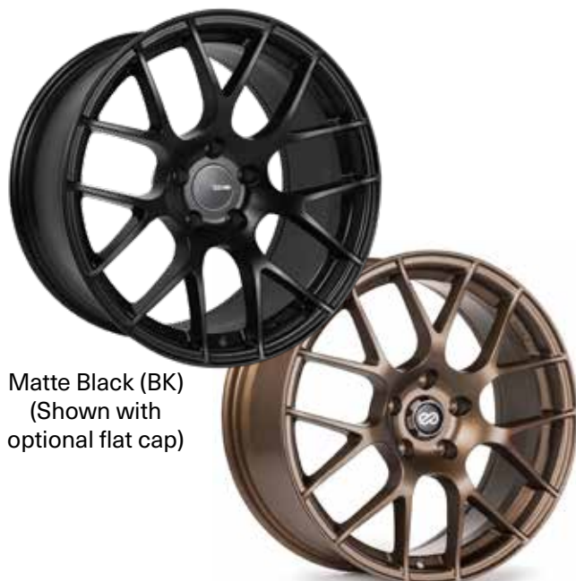
Matte Black (BK) (Shown with optional flat cap)