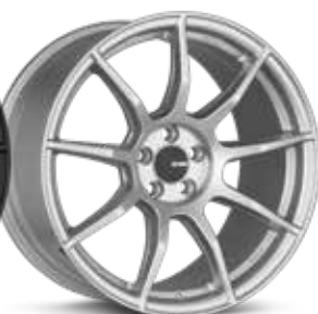
Matte Silver (SP)