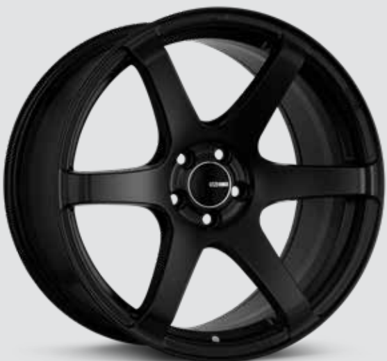
Matte Black (BK)