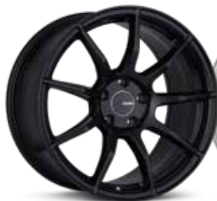
Matte Black (BK)