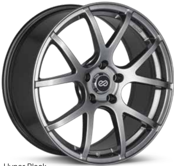
Hyper Black (HB)