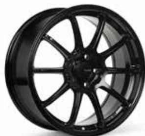
Gloss Black (BK)