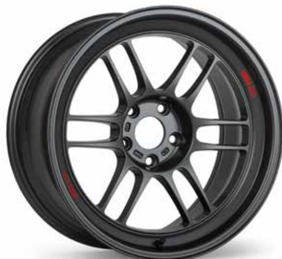
Dark Gunmetal (GM)