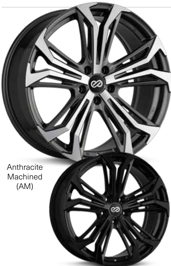
Anthracite Machined (AM)