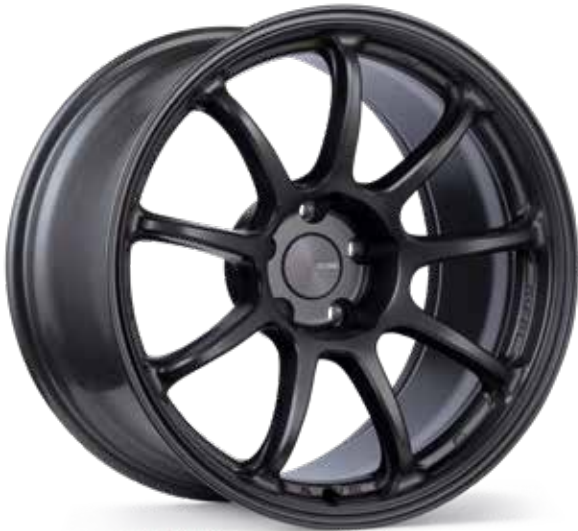
Matte Gunmetal (GM)