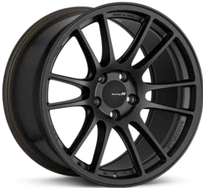
Matte Gunmetal (GM)