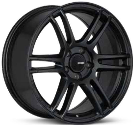
Matte Black (BK)