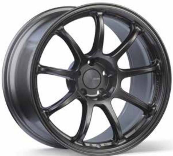
Dark Silver (DS)