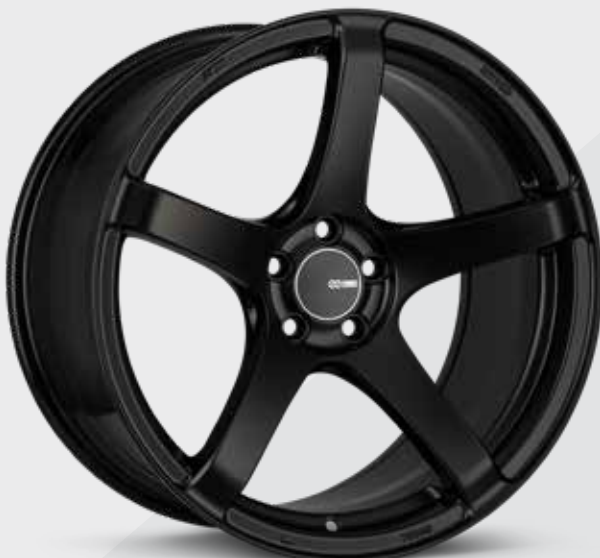
Matte Black (BK)