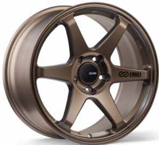
Matte Bronze (ZP)