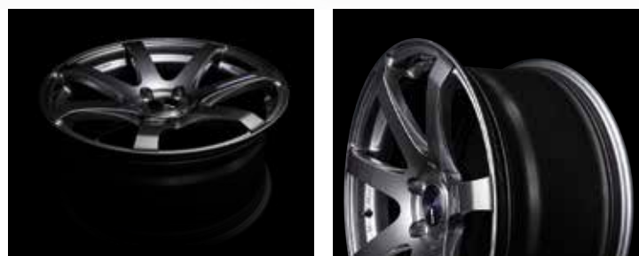
Dark Silver (DS)

Sept rayons d'allure dynamique s'étirent vers le rebord de la jante et créant une forme concave pour donner à la roue une profondeur supplémentaire et l'impression d'être une taille supérieure. Les côtés des rayons sont amincis pour les rendre plus légers tout en soulignant la forme concave. Le tout est associé à un rebord à double lèvre pour un look particulièrement agressif. Les concepts de la robustesse et du sport servent d'inspiration pour ces caractéristiques de conception. La jante de la roue est formée avec la technologie MAT pour atteindre un haut niveau de résistance, de rigidité et de légèreté. La face est conçue pour permettre l'installation d'un grand étrier de frein et pour améliorer les performances de refroidissement des freins lors de la conduite à grande vitesse.