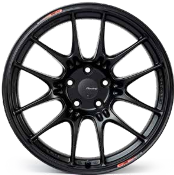
Matte Black (BK)

Visit Enkei.com for cap part numbers Each GTC02 includes two Racing Prototype stickers Valve Stem# V429-0000SP for Hyper Silver, V429-0000BK for Black