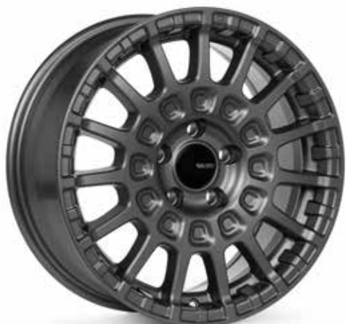
Matte Gunmetal (GM) (Special Order)