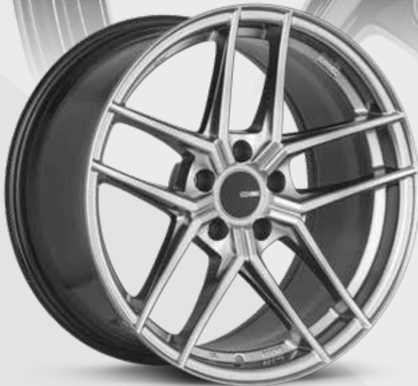
Hyper Silver (HS)

La TY-5 d'Enkei est une entrée excitante dans la série de performance légère d'Enkei. Elle propose une combinaison élégante d'un style à cinq rayons divisés avec les éléments de style centraux d'une roue à rayons croisés. La TY-5 est un excellent choix pour une grande variété de véhicules, des petits coupés sport aux voitures de luxe de grande taille. Elle est offerte en plusieurs couleurs attrayantes, dont l'hyper noir, le noir brillant et un tout nouveau noir nacré limité. La TY-5 est offerte en profils concaves et plats selon la taille et la largeur, et comprend le chapeau de roue central plat caractéristique d'Enkei.