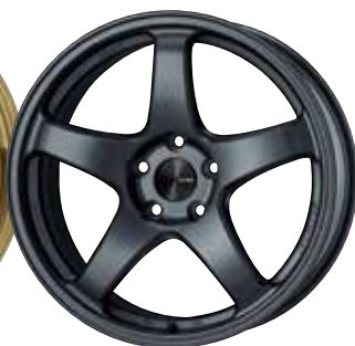
Matte Gunmetal (Special Order)