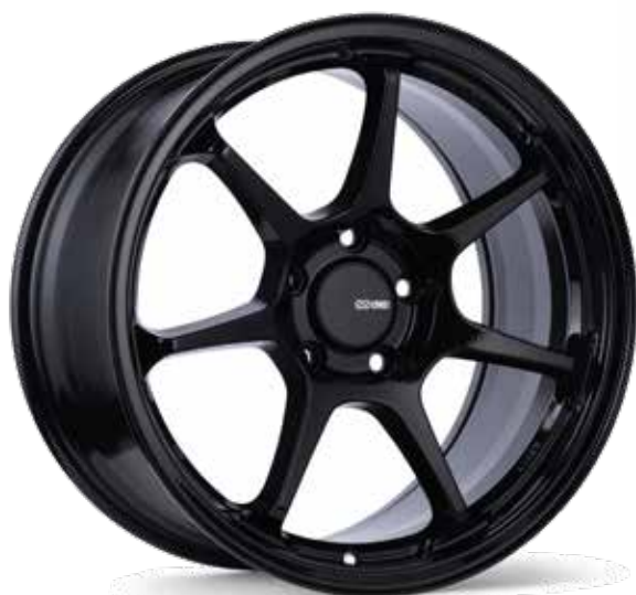
Gloss Black (BK)

La TS-7 est le dernier né de la série de personnalisation d'Enkei. En fait, la TS-7 est essentiellement une renaissance de la classique TS-7 d'Enkei. Mais il ne s'agit pas simplement de la recreation de l'ancienne roue, la TS-7 utilise la technologie innovante MAT d'Enkei pour produire une roue à la fois légère et solide. La TS-7 est offerte en noir brillant, bronze et gris tempête, et tous les modèles sont équipés du chapeau de roue central plat caractéristique d'Enkei. Avec des dimensions allant de 18x8 à 18x9,5, la TS-7 est un excellent choix pour des voitures comme la Subaru WRX STI, la Civic Type R, la Toyota GT86 et bien d'autres.