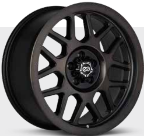
Brushed Black (BB) (17" only)