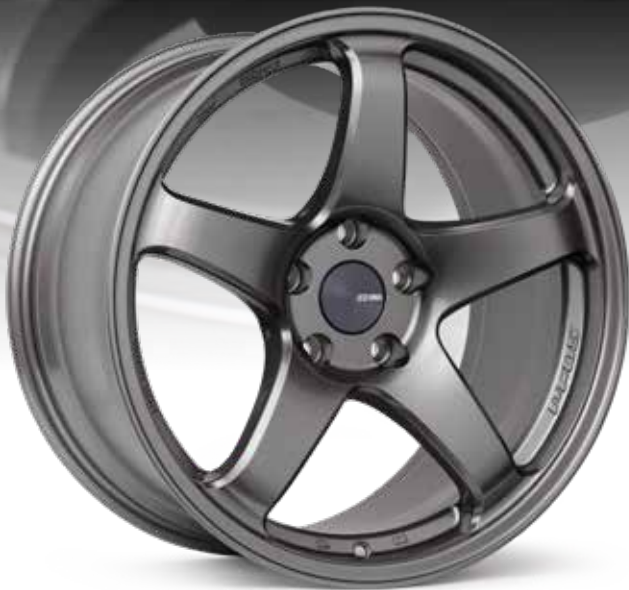
Dark Silver (DS)