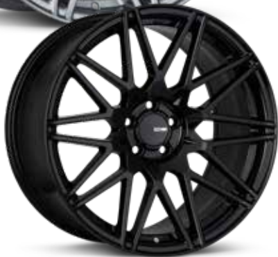
Gloss Black (BK)