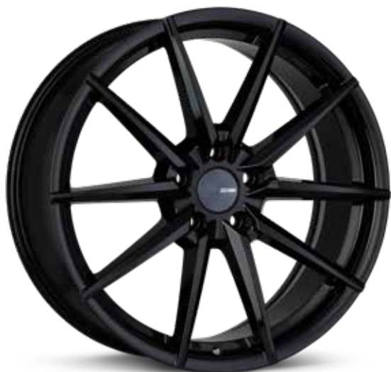
Gloss Black (BK)