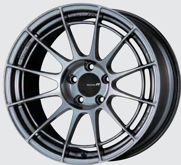
Hyper Silver (Limited Sizes / Special Order)