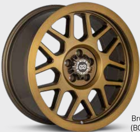
Brushed Gold (BG) (17" only)