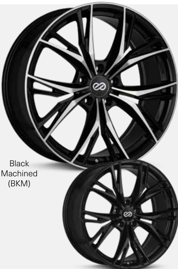
Black Machined (BKM)