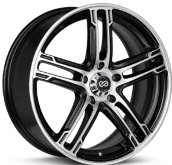
Black Machined (BKM)