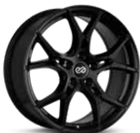
Gloss Black (BK)