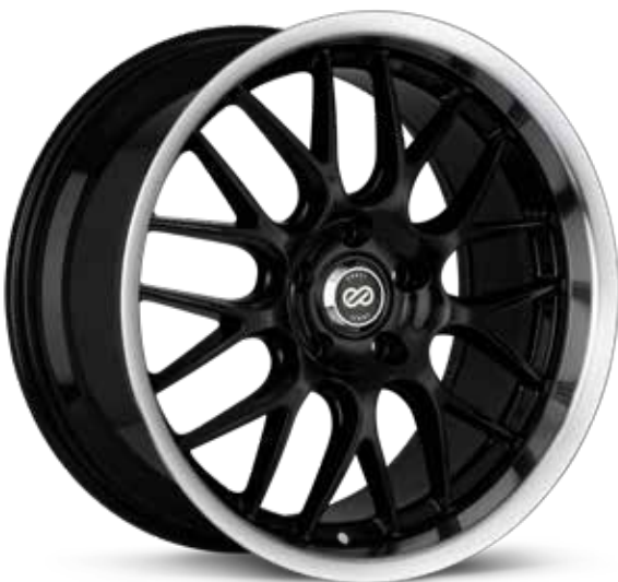
Black with Machined Lip