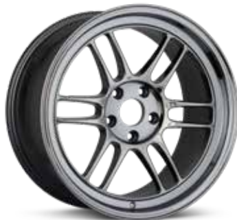
SBC (Limited Sizes)