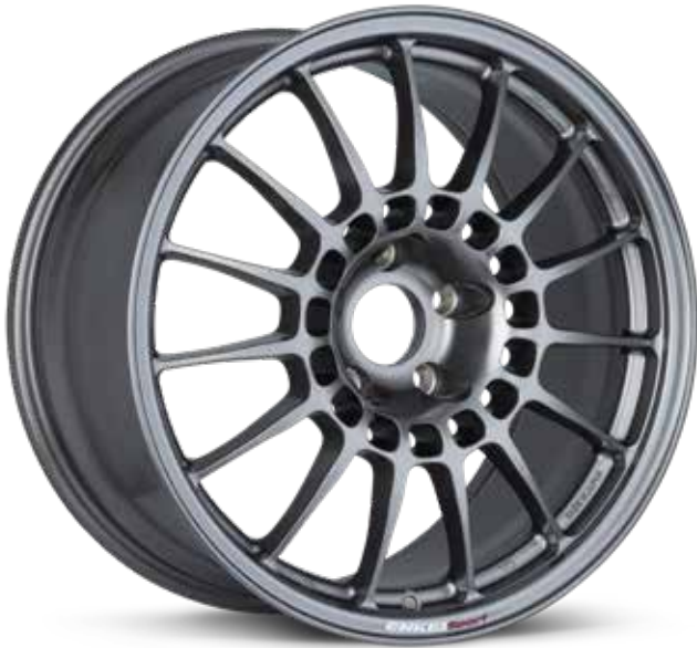
Dark Silver (DS)