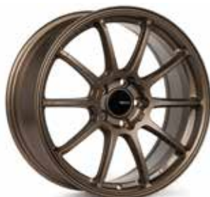
Matte Bronze (ZP)

La toute nouvelle Triumph est une jante légère à dix rayons fabriquée à l'aide de notre procédé MAT, soit le même procédé utilisé pour fabriquer la jante Enkei RPF1. L'utilisation de notre procédé MAT permet de créer une jante légère, tout en améliorant considérablement la propriété du matériau et la résistance de la jante. Les dix rayons profilés confèrent à la jante Triumph un profil léger et sportif que l'on retrouve couramment sur les pistes de course du monde entier. La jante Triumph est une option idéale pour les coupés et berlines sport modernes comme les Toyota 86 et BRZ, Civic Type R (FK), Subaru WRX, IS250/300, Nissan Z34 et bien d'autres.