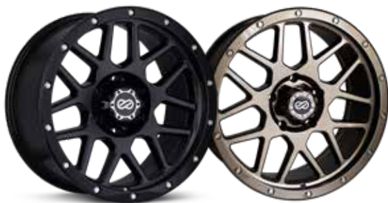
Gloss Black (BK)