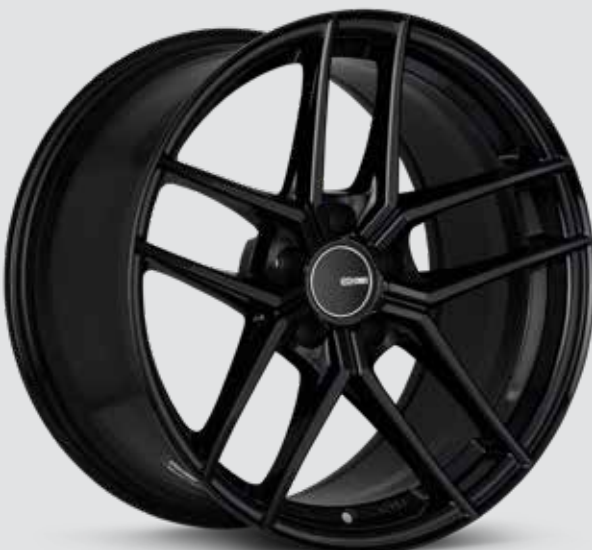
Gloss Black (BK)