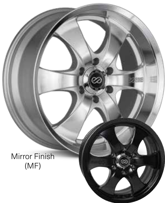
Mirror Finish (MF)