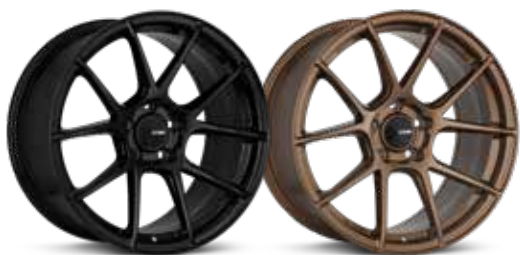
Gloss Black (BK) Gloss Bronze (ZP)