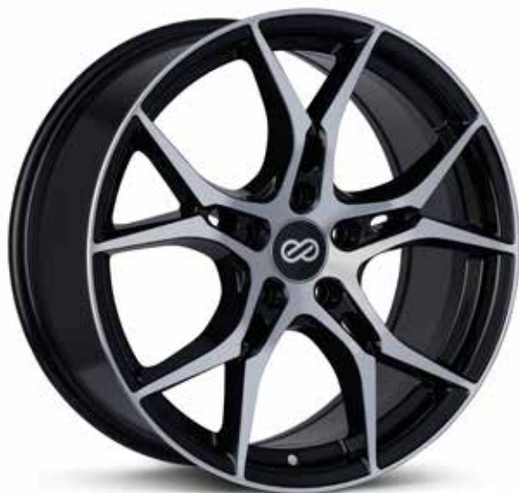
Black Machined (BKM)