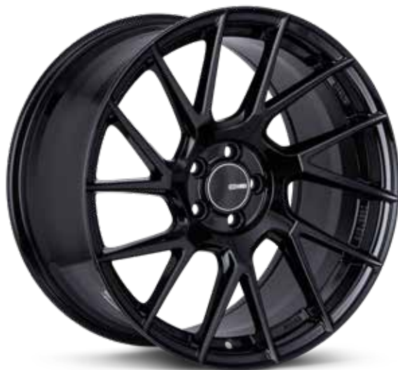
Gloss Black (BK)