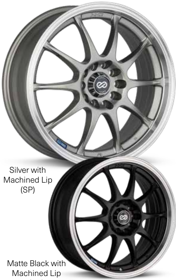
Silver with Machined Lip (SP)