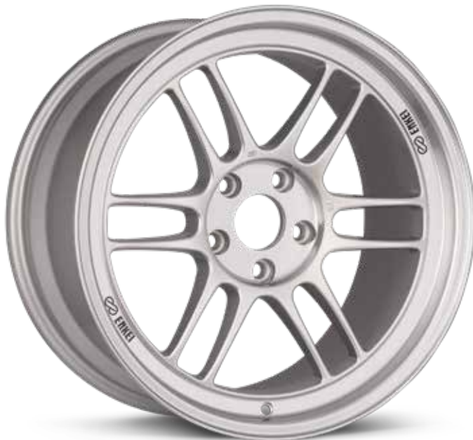
F1 Silver (SP)

14 | 15 | 16 | 17 | 18 - SÉRIES DE COURSE