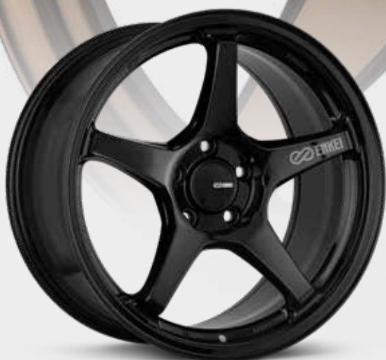
Gloss Black (BK)

La légère TS-5 d'Enkei est sûre de devenir un classique instantané dans le monde de la personnalisation. Tous ceux qui admireront la TS-5 en resteront bouche bée, car elle fait tout et elle le fait bien. Elle est remarquablement simple et propre, s'appuyant sur la formule éprouvée de cinq rayons et d'une lèvre, mais la TS-5 a une esthétique parfaite. C'est le nombre d'or sous forme de roue. Elle évoque à la fois le sport motorisé et la classe. Elle est aussi à l'aise sur une piste que dans la rue. Avec des dimensions de 17 et 18 po et des largeurs allant jusqu'à 9,5 po, la TS-5 conviendra à une variété remarquable de berlines et de coupés sport.