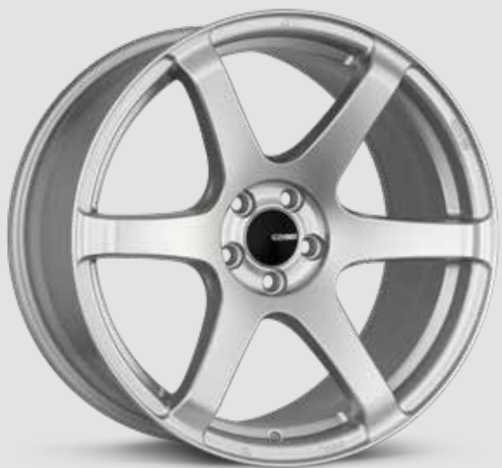
Matte Silver (SP)