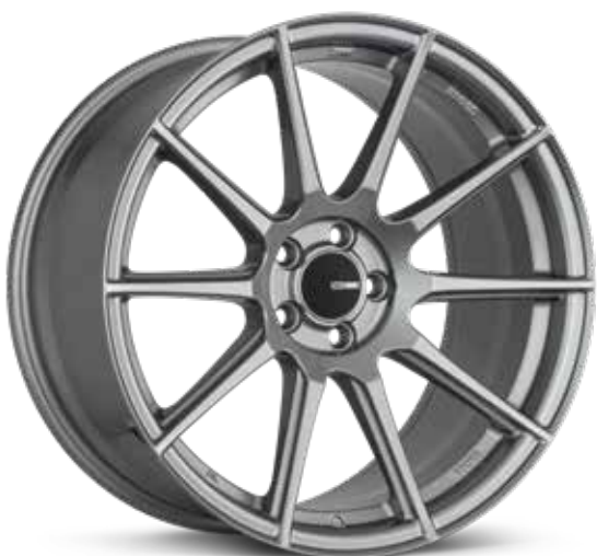
Storm Gray (GR)