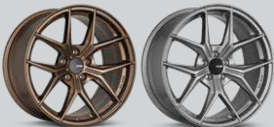
Gloss Bronze (ZP)