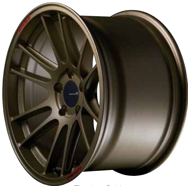
Titanium Gold (Limited Sizes / Special Order)