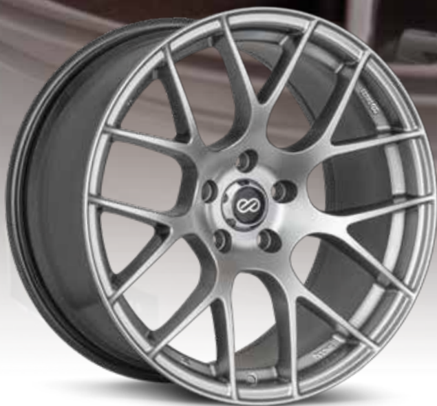
Hyper Silver (HS)