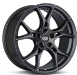
Gloss Anthracite (AP)