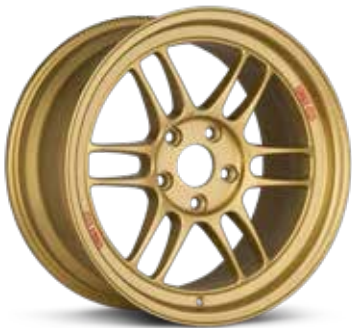
Gold (GG) (Limited Sizes)