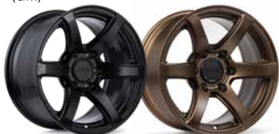
Matte Black (BK)