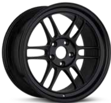
Black (BK) (Limited Sizes)