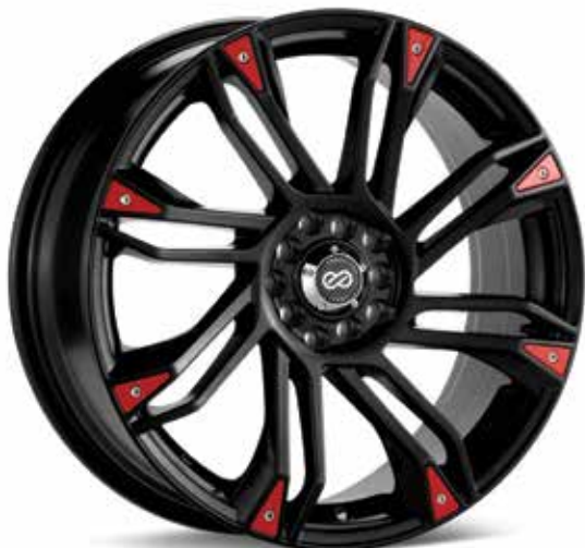
Matte Black with Red Trim (BK)