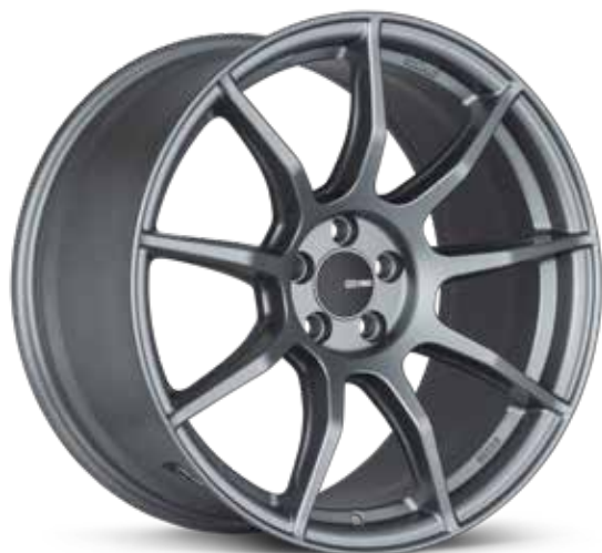
Platinum Gray (GR)