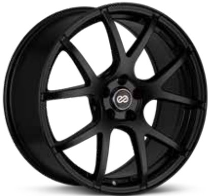
Matte Black (BK)