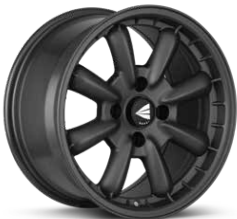
Matte Gunmetal (GM)