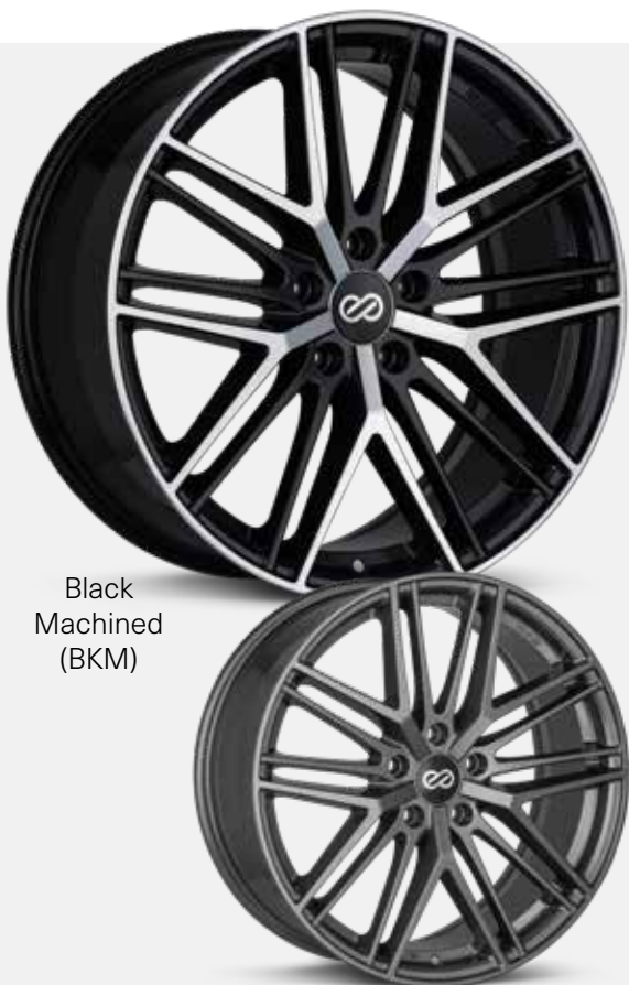
Black Machined (BKM)