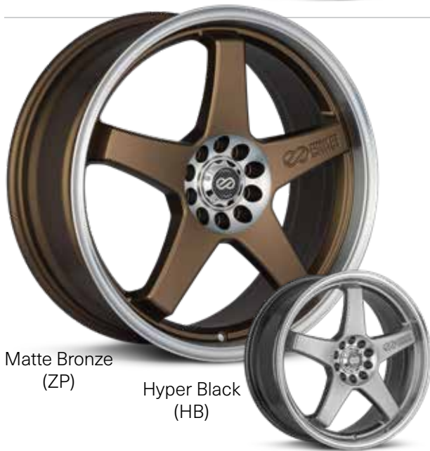
Matte Bronze (ZP)