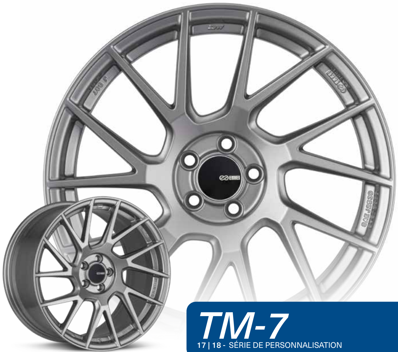
Storm Gray (GR)