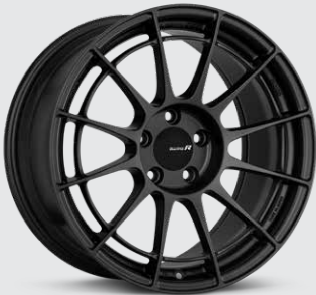
Matte Gunmetal (GM)