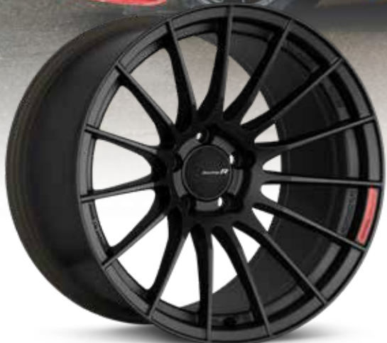
Matte Gunmetal (GM)

Conçu pour avoir une apparence incroyable tout en conservant la fonctionnalité et l'esprit de course d'Enkei. La RS05RR, très légère, est fabriquée à l'aide de la méthode de fluotournage MAT-DURA d'Enkei. Avec la RS05RR, nul besoin de choisir entre la forme ou la fonction, vous pouvez avoir les deux, tout simplement. Elle est offerte en modèles de 18x8,5 à 18x11 et propose trois designs de faces concaves différents, au fini argent ou bronze industriel mat.