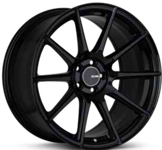
Gloss Black (BK)