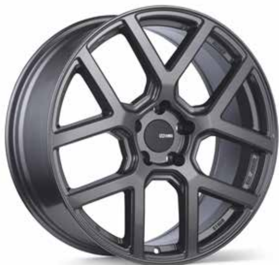
Gloss Gunmetal (GMH)