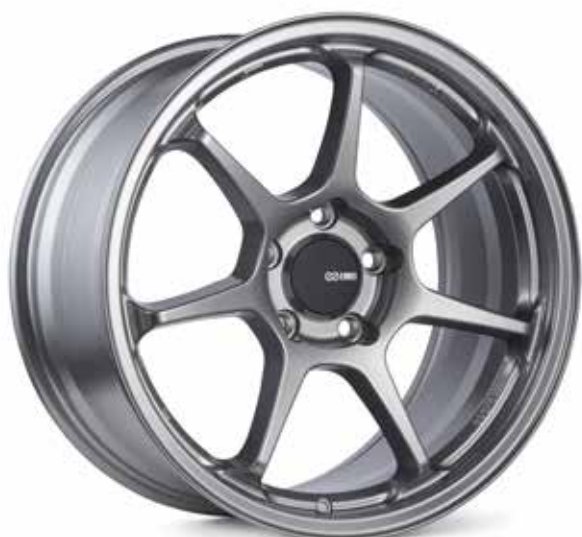
Storm Gray (SP)