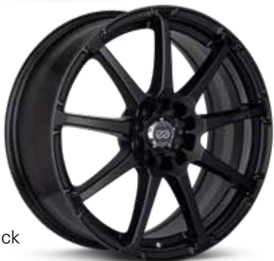
Matte Black (BK)