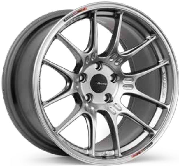
Hyper Silver (HS)