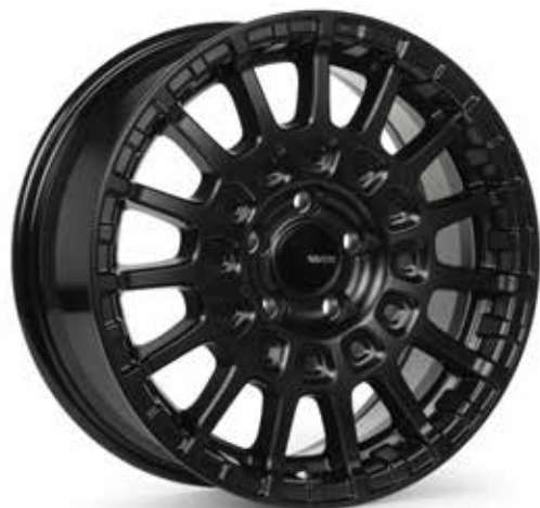
Matte Black (BK)