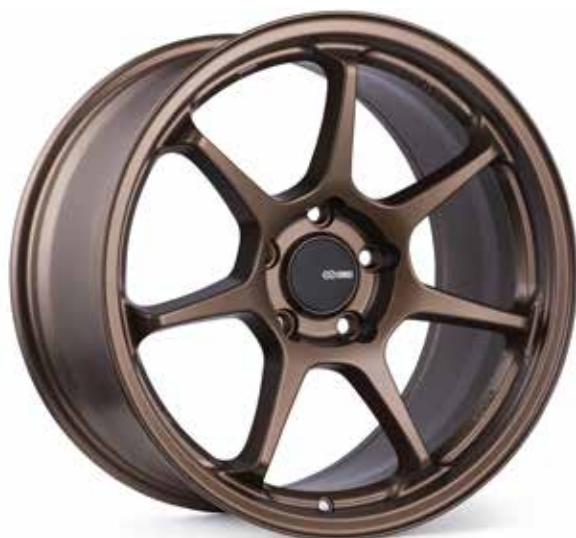
Matte Bronze (ZP)

La TS-7 est le dernier né de la série de personnalisation d'Enkei. En fait, la TS-7 est essentiellement une renaissance de la classique TS-7 d'Enkei. Mais il ne s'agit pas simplement de la recreation de l'ancienne roue, la TS-7 utilise la technologie innovante MAT d'Enkei pour produire une roue à la fois légère et solide. La TS-7 est offerte en noir brillant, bronze et gris tempête, et tous les modèles sont équipés du chapeau de roue central plat caractéristique d'Enkei. Avec des dimensions allant de 18x8 à 18x9,5, la TS-7 est un excellent choix pour des voitures comme la Subaru WRX STI, la Civic Type R, la Toyota GT86 et bien d'autres.