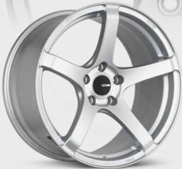
Matte Silver (SP)

La KOJIN reprend le design traditionnel à cinq rayons et y ajoute les contours adéquats pour lui donner un look personnalisé agressif sans en faire trop. La KOJIN est fabriquée à l'aide de la technologie MAT originale d'Enkei pour atteindre le summum de la résistance et de la légèreté. La KOJIN d'Enkei conjugue l'art et la science pour créer la prochaine grande avancée en matière de roues.