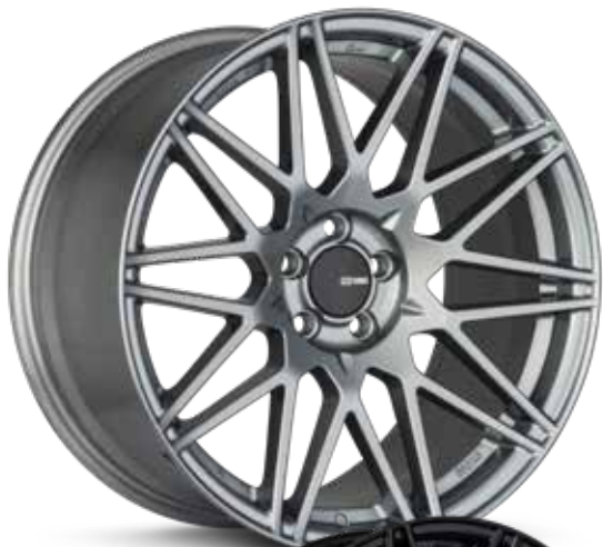
Storm Gray (GR)