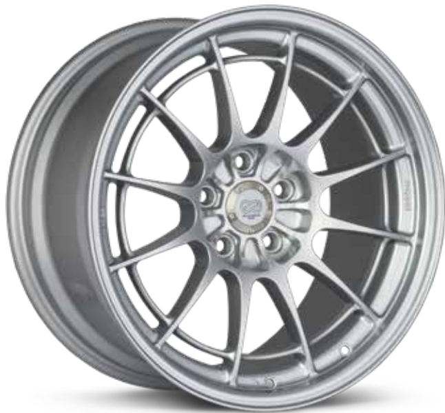
F1 Silver (SP)