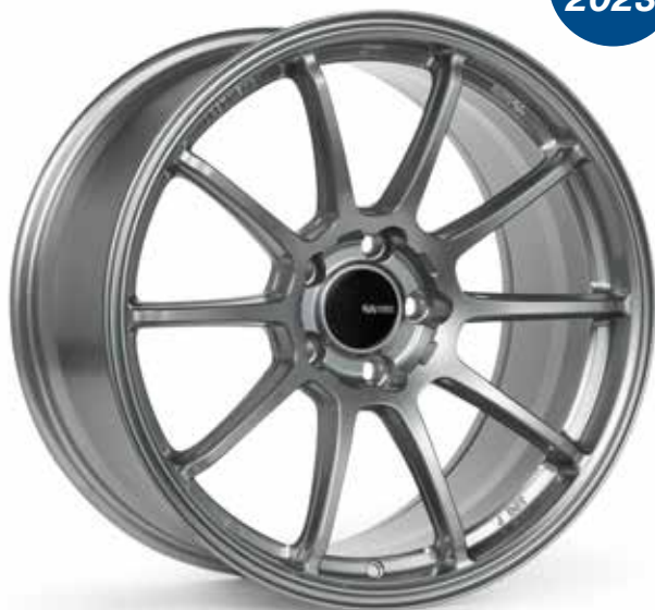
Storm Gray (GR)