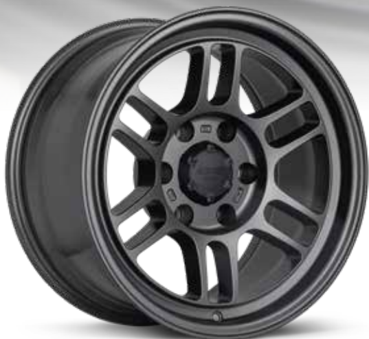
17x9 w/cap Matte Dark Gunmetal (GM)