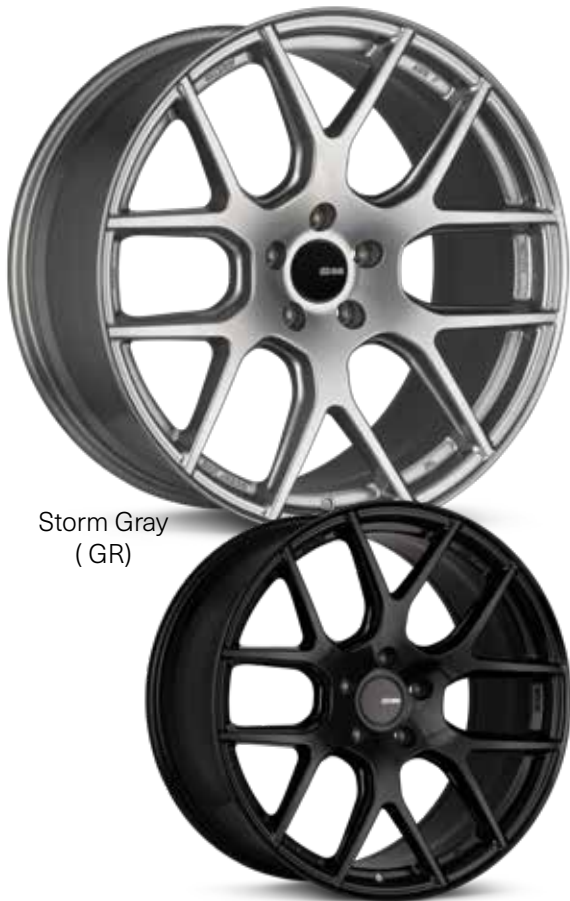
Storm Gray (GR)