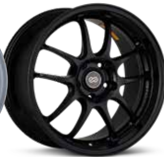
Matte Black (BK)